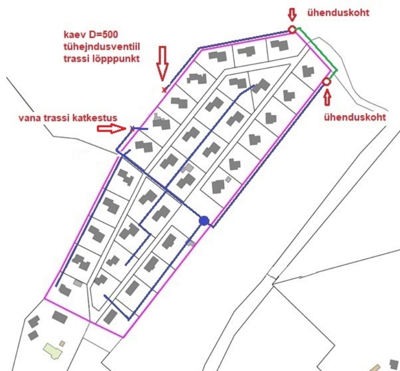
SÜ Mere veetrassid seisuga 2018.a.